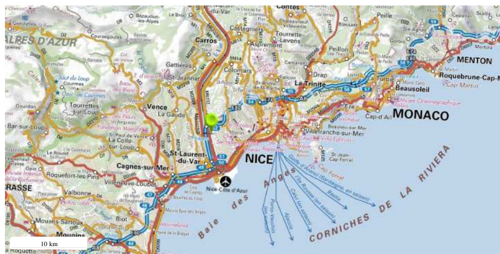
Périmètre du SIS Cartes IGN - IGN